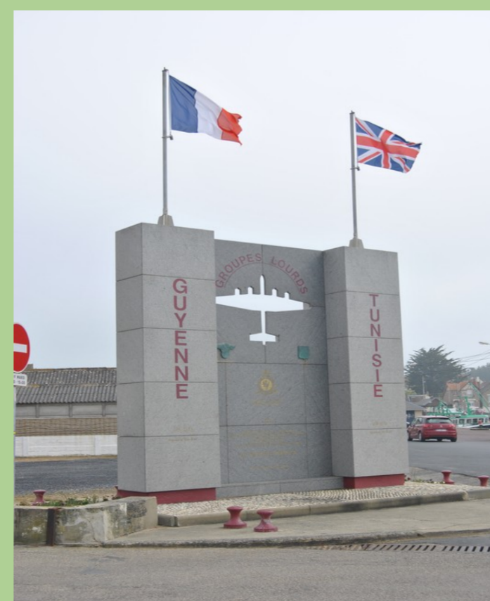
Monument commémoratif à ELVINGTON (Angleterre)