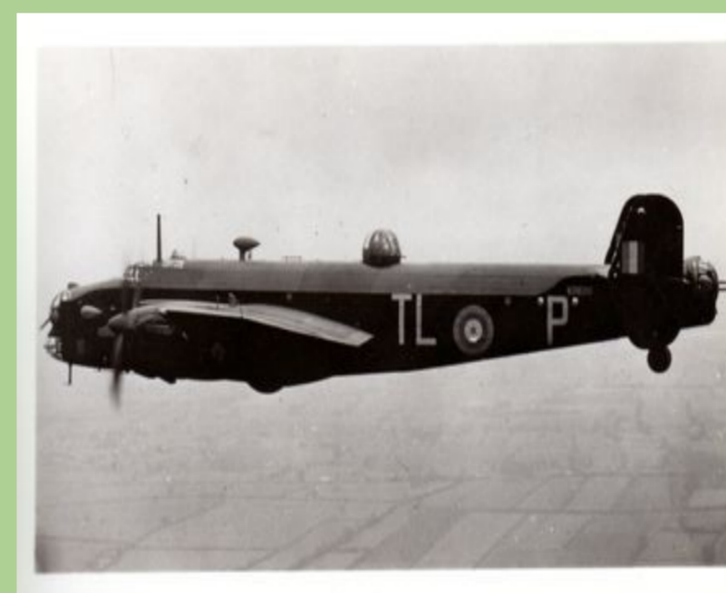
Halifax en vol