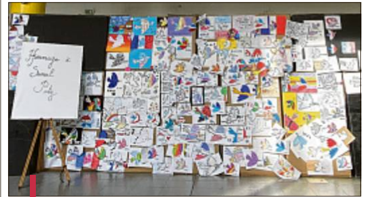
Le travail réalisé par les collégiens des Garrigues.